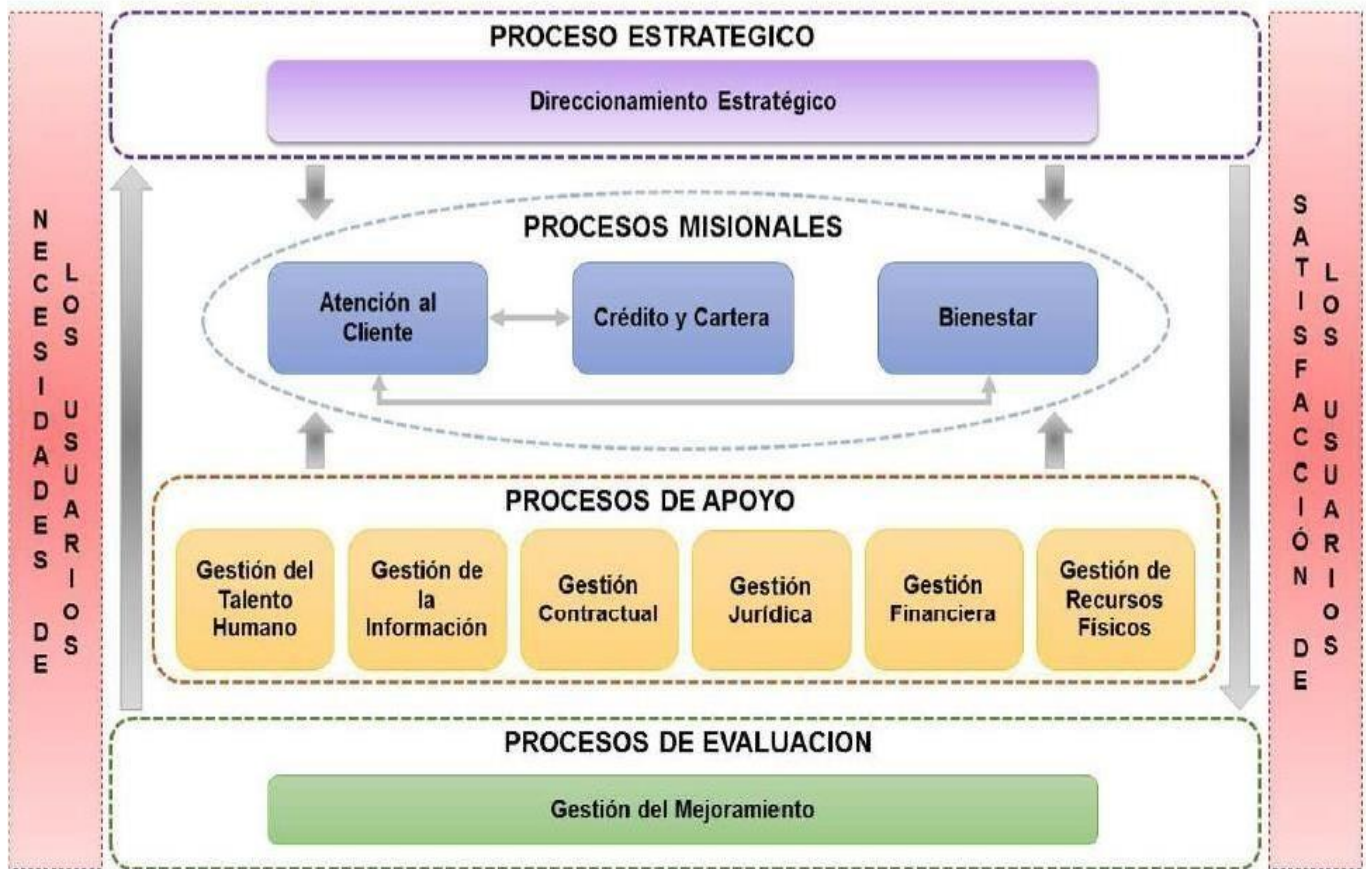
Ilustración 2. Mapa de Procesos CSC